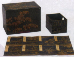
櫃入り嫁入本「源氏物語」（個人蔵）