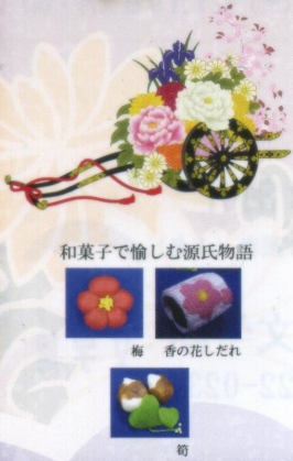
和菓子で愉しむ源氏物語