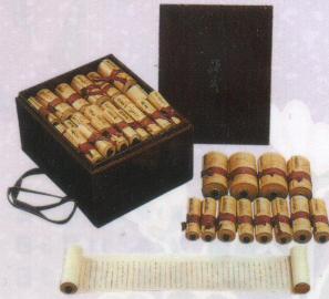
「源氏物語」袖珍本（早稲田大学図書館蔵）

千年以上も前に書かれた『源氏物語』には、雅やかな文化を背景に、四季の美しさや、恋に生きる男女の心や「あはれ」の情趣が、豊かな筆致で綴られています。源氏物語からインスピレーションを受け、今も新たな作品が生まれ出されるなど、脈々と受け継がれる源氏物語のDNAを、和歌を中心に、各帖の魅力をもとに、錦絵などをまじえてご紹介します。