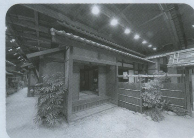
「龍馬伝」幕末志士社中