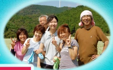
前回ツアーに参加された方々

ももいろさんが眠る きらきらサンゴ礁。 手つかずの自然がどっさり！ そんな大月町を 満喫できるツアーです！